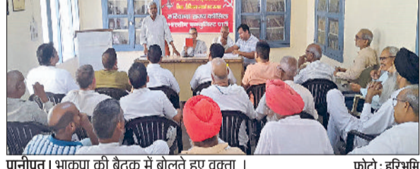
पानीपत। भाकपा की बैठक में बोलते हुए वक्ता।