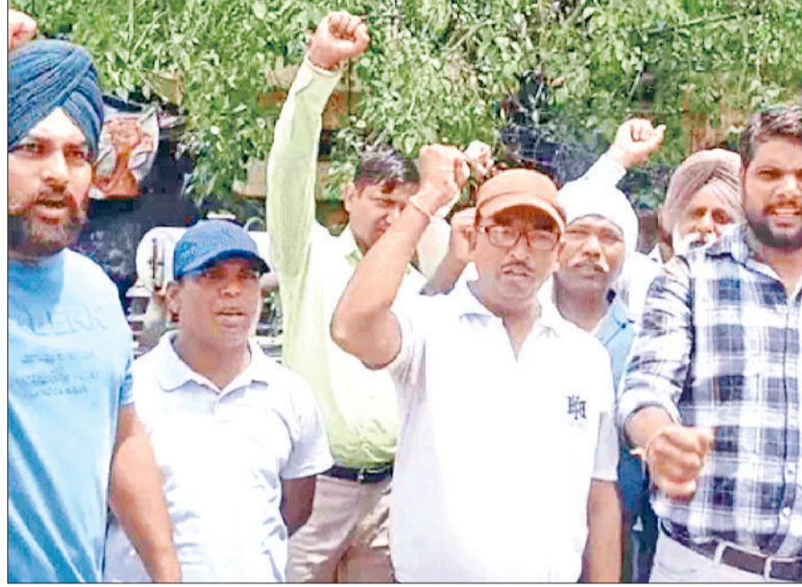
अंबाला। एसडीओ को सस्पेंड करने पर विरोध प्रदर्शन करते बिजली निगम के कर्मचारियों।

हरिभूमि न्यूज अंबाला बर्फखाना जमीन पर विवाद में मीटर कनेक्शन काटने के बाद बिजली विभाग के एसडीओ को सस्पेंड करने के विरोध में बिजली कर्मचारी सड़क पर उतर आए। कर्मचारियों ने कार्रवाई के विरोध में जमकर प्रदर्शन किया। इस दौरान कर्मचारियों ने आंदोलन की चेतावनी दी है। दरअसल अंबाला कैंट में बर्फ खाना की जमीन को लेकर विवाद लगातार बढ़ता जा रहा है।