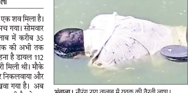
अंबाला। नौरंग राय तालाब में युवक की तैरती लाश।

अंबाला शहर के नौरंग राय तालाब से एक शव मिला है। शव मिलने के बाद लोगों में हड़कंप मच गया। सोमवार दोपहर को शहर के नवरंग राय तालाब में करीब 35 वर्षीय युवक का शव मिला है। युवक की अभी तक पहचान नहीं हो सकी। पुलिस का कहना है डायल 112 पर किसी ने शव मिलने की जानकारी मिली थी। मौके पर पहुंची पुलिस टीम ने शव को बाहर निकलवाया और उसे शहर के सिविल हस्पताल में रखवा गया है। अब पुलिस मृतक की पहचान का प्रयास कर रही है। दोपहर को एक युवक तालाब में मछलियों को दाना डालने आया था। उसने पानी में तैर रही लाश को देखा था। इसके बाद उस युवक ने आसपास के लोगों को इसकी जानकारी दी। लोगों ने खुद लाश देखने के बाद पुलिस को इसकी सूचना दी। इसके बाद लाश को बाहर निकाला गया। बता दें कि नौरंग राय सरोवर के साथ ही