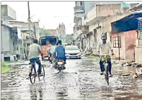
अंबाला। बरसात के बाद सड़कों पर जलभराव की स्थिति।

सुबह अचानक शुरू हुई तेज बारिश के कारण कई इलाकों में जलभराव हो गया है। विशेष रूप से निचले इलाकों और अंडरपास में पानी जमा हो गया है, जिससे लोगों को आवागमन में परेशानी हो रही है। नगर निगम के दायों के बावजूद जल निकासी की व्यवस्था अपर्याप्त साबित हुई है। कई सड़कों पर पानी भरा हुआ है। हालांकि नगर निगम ने कई जगह पंप सेट चालू करा कर पानी निकासी का काम शुरू करा दिया है। अंबाला शहर में निचले इलाकों में खासा जलजमाव हो गया है। बराड़ा का अधोया रोड, अनाज मंडी, रेलवे अंडरपास, बीडीपीओ ऑफिस के सामने मेन रोड, बंसल पैलेस चौक के पास बराड़ा गांव की तरफ जाने वाली सड़क समेत विभिन्न क्षेत्रों में काफी पानी भर गया। इसके अलावा अंबाला शहर