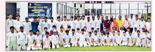
ऑस्ट्रेलिया क्रिकेट प्रतियोगिता के ट्रायल के लिए पहुंचे खिलाड़ी।