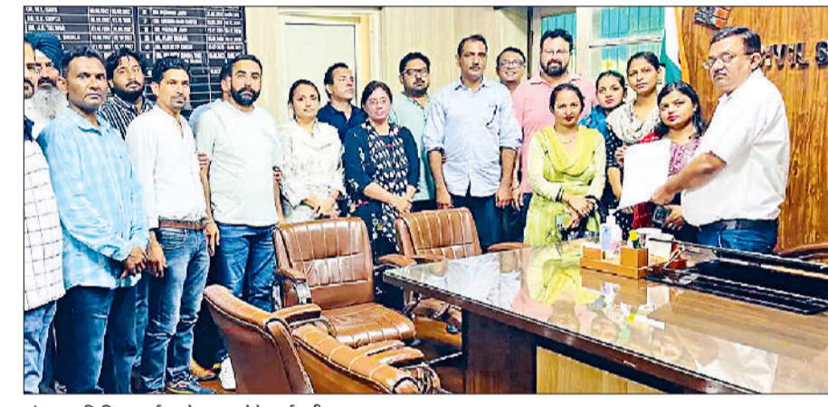
अंबाला। सिविल सर्जन को ज्ञापन देते कर्मचारी।

एनएचएम कर्मचारियों को पिछले तीन महीने से वेतन नहीं मिल पाया। इसी वजह से ज्यादातर कर्मचारियों के सामने आर्थिक संकट खड़ा है। इसी वजह से सोमवार को कर्मचारियों ने स्वास्थ्य विभाग के निदेशक को सिविल सर्जन के जरिए ज्ञापन भेजा है। कर्मचारियों के अनुसार, जब भी कभी कोई आपदा आती है तो उस समय एनएचएम कर्मचारी हमेशा पंक्ति में सबसे आगे होता है। चाहे वह बाढ़ की स्थिति हो या फिर कोविड, डेंगू, मलेरिया और चिकनगुनिया जैसी महामारी से लड़ने का समय हो। काफी लंबे समय से कर्मचारियों की तनख्वाह सही समय पर नहीं मिल पा रही है।