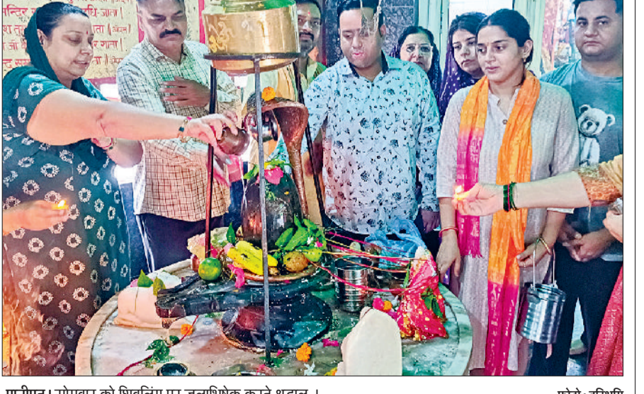
पानीपत। सोमवार को शिवलिंग पर जलाभिषेक करते श्रद्धालु।

जलाभिषेक करते हैं। हालांकि सोमवार को जलाभिषेक करने वाले श्रद्धालुओं की संख्या अधिक होती है। इसलिए आज