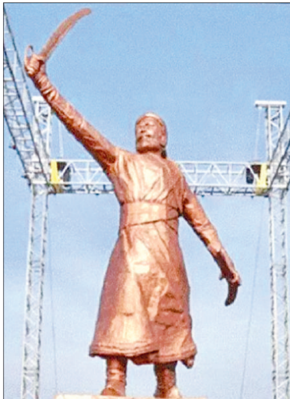
अंबाला। छत्रपति शिवाजी महाराज की प्रतिमा।

अंबाला छावनी में छत्रपति शिवाजी महाराज की प्रतिमा स्थापित करने को लेकर नगर परिषद ने कार्रवाई तेज कर दी है। प्रतिमा कहाँ स्थापित की जाएगी इसके लिए परिषद की ओर से तीन संभावित स्थानों की तलाश की जा रही है। जैसे ही जगह फाइनल होगी, काम शुरू कर दिया जाएगा। परिवहन मंत्री अजित विज पहले ही प्रतिमा के लिए 50 लाख रुपये की राशि मंजूर कर चुके हैं। यह बजट प्रतिमा निर्माण और स्थापना दोनों कार्य पर खर्च किया जाएगा। बता दें कि अंबाला कैट में पहले से